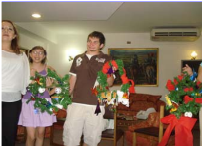
Los participantes del concurso de guirnaldas muestran las tres ya terminadas